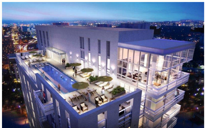
屋上テラスイメージパース