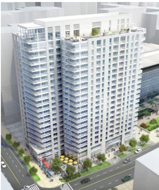
外観イメージパース