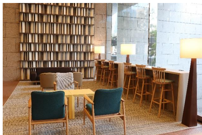
コミュニケーションラウンジ