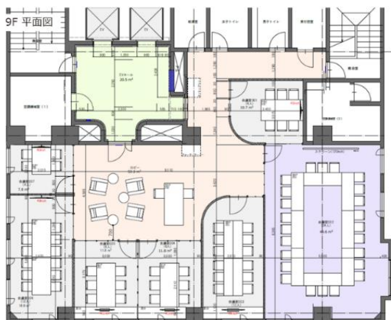
9階会議室のフロアプラン

施設概要:9階に6～24人で使用可能な会議室を7室開設いたします。LINK-J会員であれば、平日だけでなく、土日も利用可能となります。これによって、ライフサイエンスビルディング2では、各階のオープンスペースでの打ち合わせ・作業等に加え、よりプライベートな会議も可能となります。また、エントランスホールなどの共用スペースについても合わせてリニューアルを行います。