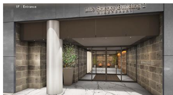
エントランスイメージ