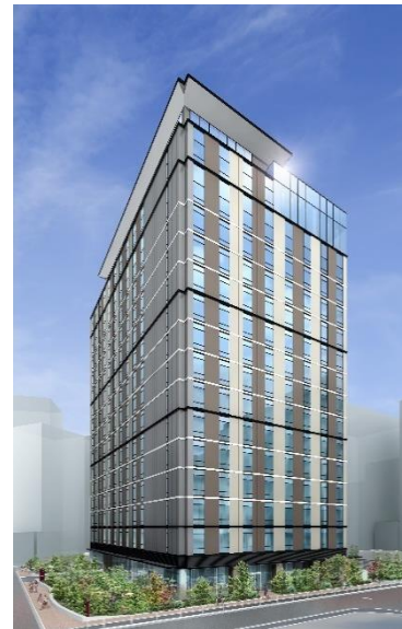
三井ガーデンホテル五反田 (完成予想パース)