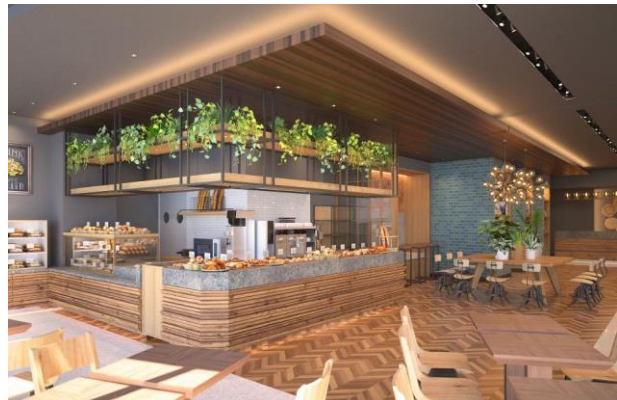
ベーカリーカフェ・レストラン（イメージCG）