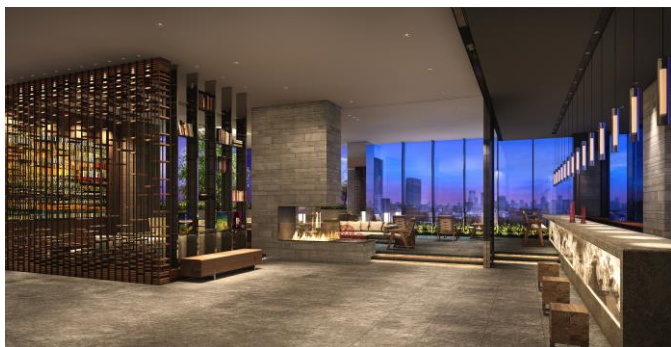
スカイロビー（イメージCG）