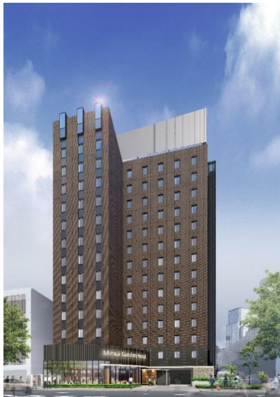
三井ガーデンホテル大手町 (完成予想パース)

現在、三井ガーデンホテルズは、日本全国で20施設・5,337室を運営しておりますが、両2ホテルの開業により、22施設・5,898室となる予定です。今後も大都市圏や地方政令指定都市を中心に積極的に新規展開を行うとともに、ワンランク上の宿泊主体型ホテルとして「お客様の五感を満たすホテル」、「記憶に残るホテル」を目指し、ホスピタリティ溢れるサービスの提供に努めてまいります。