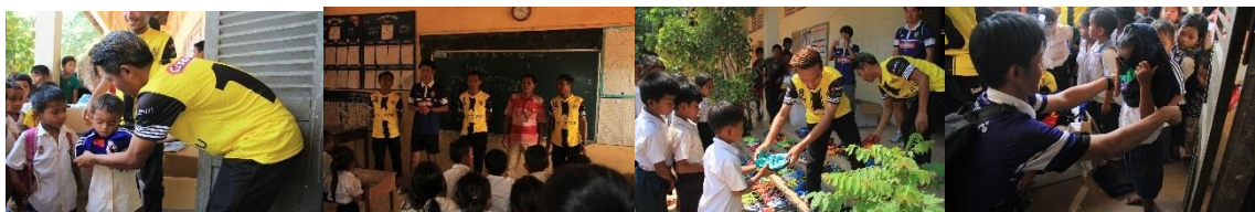
カンボジアでの寄贈の様子(2018年3月)