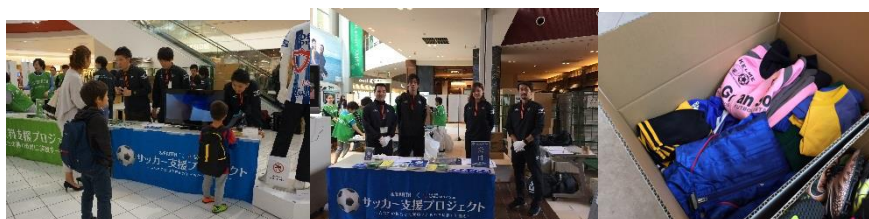
第2回の各会場でのサッカー用品回収の様子

実績の詳細については JRCC HP ( http://www.jrcc.or.jp/ ) にてご確認頂けます。