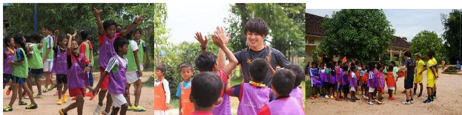
カンボジアでのサッカークリニックの様子(2017年7月)

概要 ソルティーロの海外拠点スタッフや選手の協力により、サッカー用具の寄贈に加えて子供たちにサッカーの基本技術やチームワークの大切さを伝え、学びの機会を提供してまいります。