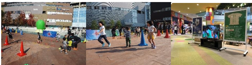
第2回の各会場でのイベントの様子