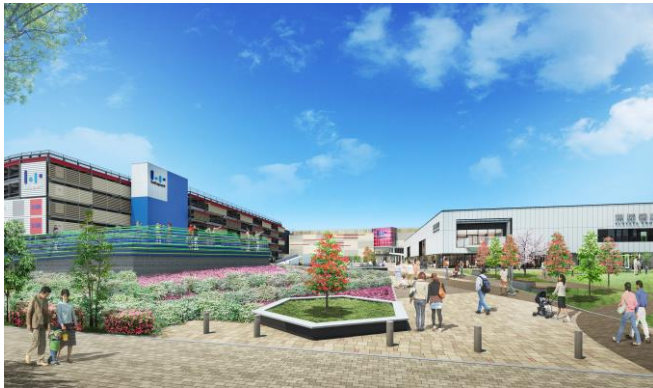
「ウェルカムアプローチ」