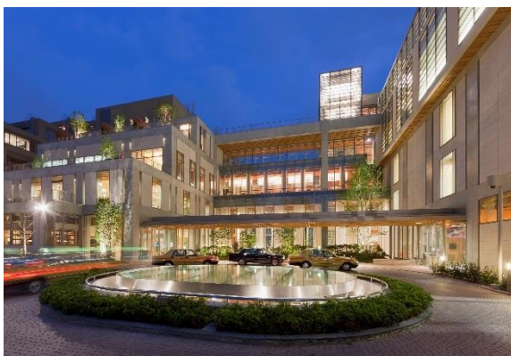
東京アメリカンクラブ メインエントランス(東京都港区)

“Tokyo American Club is honored to enter into a partnership with Mitsui Fudosan and become part of the exciting redevelopment of the historic Nihonbashi district. The Club has been a hub for Tokyo’s international community since 1928, first in Yurakucho and Marunouchi then later in Azabudai, where we call home today. The prospect of opening our first satellite facility, in Nihonbashi, would be a truly momentous event for our membership. We look forward to becoming an integral part of the Nihonbashi community while building on our relationship with Mitsui Fudosan.”