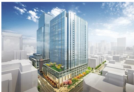
「日本橋室町三井タワー」外観イメージパース

「日本橋室町三井タワー」は、当社が取り組む「日本橋再生計画」において、日本橋エリアの情報発信拠点となる最新の大規模複合ビルです。最先端のオフィス空間、様々な用途に利用できるホール&カンファレンス、日本初となる既存街区を含むエリア供給型のエネルギープラントなどに加え、日本橋に新たな賑わいを創出する商業施設や、豊かな緑あふれる潤いのランドスケープと大屋根を配した広場を備え、日本橋エリアの魅力のさらなる向上を実現します。