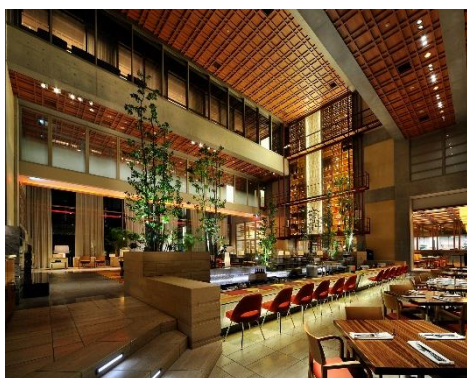
東京アメリカンクラブ バー 「CHOP Bar」(東京都港区)