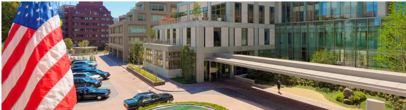
東京アメリカンクラブ メインエントランス(東京都港区)

東京アメリカンクラブは1928年から続く伝統ある格式高い会員制クラブであり、会員に対して文化、ビジネス、レクリエーションなど多様な側面から施設やイベントを提供し、東京において国際的なコミュニティを創出しています。東京都港区麻布台二丁目所在の施設では、5つのレストラン、会議施設、宿泊施設、フィットネスクラブ、スパ、ルーフトッププールなどの施設を備え、2018年にClub Leaders Forumの選出する“Platinum City Clubs of the World top 100”に名を連ねるなど国際的に高い評価を得ており、サテライトクラブの開設は本施設が初となります。