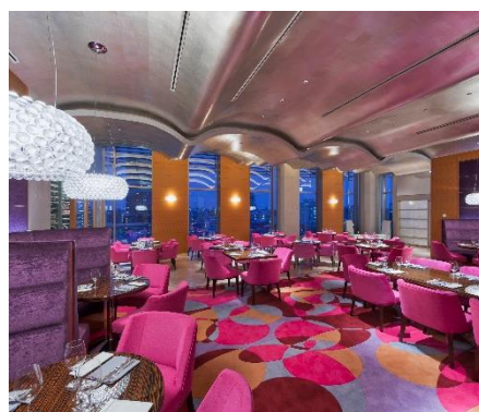
東京アメリカンクラブ レストラン 「CHOP Steakhouse」 (東京都港区)