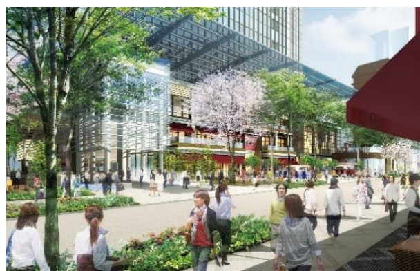
「日本橋室町三井タワー」大屋根を配した広場イメージ