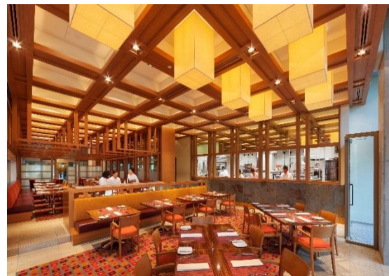
東京アメリカンクラブ レストラン 「American Bar & Grill」(東京都港区)