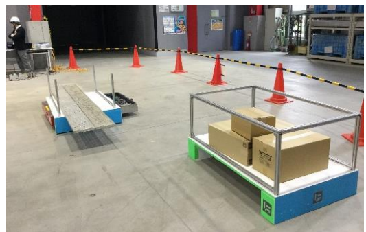
写真 2 専用パレット