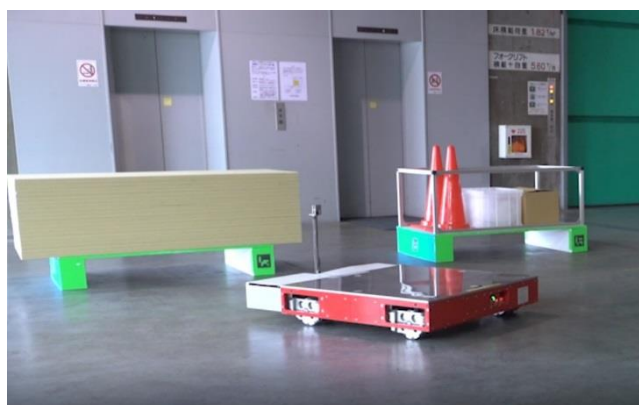
自動搬送システム

自動搬送システムは、大林組が開発した低床式 AGV(Auto Guided Vehicle)*をベースに、各種機能を加え開発しました。