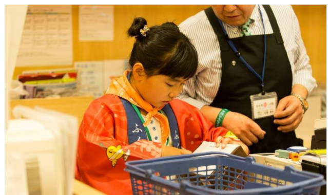
「日本橋ふくしま館」観光 PR 体験