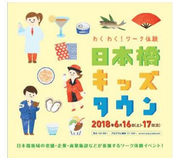
<日本橋キッズタウン キービジュアル>