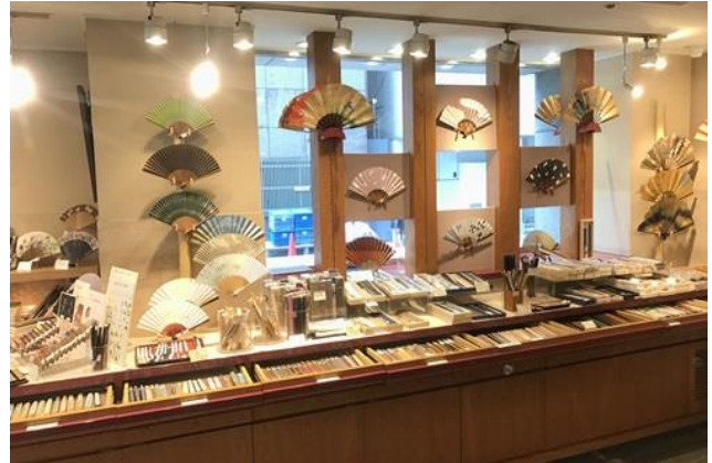
「伊場仙」絵付け体験