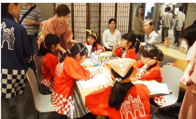
「日本橋案内所」外国人案内体験

日本橋案内所で実際に外国人に英語で案内するインバウンド体験や、地方自治体のアンテナショップで衣装を着て県産品をアピールする「観光 PR」体験もご用意しております。