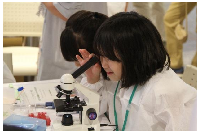
「中外製薬」バイオ実験教室