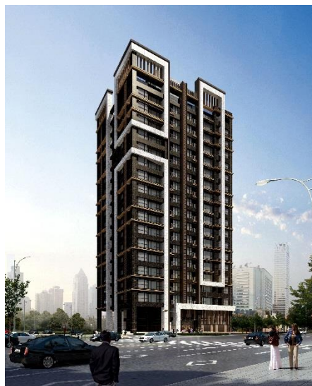
「三重中興橋計劃案（暫定名稱）」完成預想透視圖

該座落地點除了鄰近市中心並具備多元未來性，亦鄰近淡水河與大台北都會公園等大自然，可享受坐擁綠意的居住環境。此外，商品企劃方面預計將採用日式的色彩選擇方案、定期售後服務、Panasonic 製智能住宅控制系統等，將擁有日本國內外豐碩實績的各業界翹楚所獨有的創意巧思加入其中。